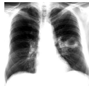
Gambar 1c. Citra format SVG + XML